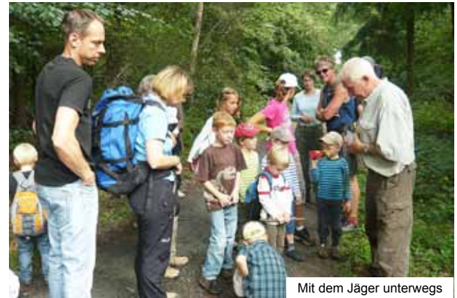
Mit dem Jäger unterwegs