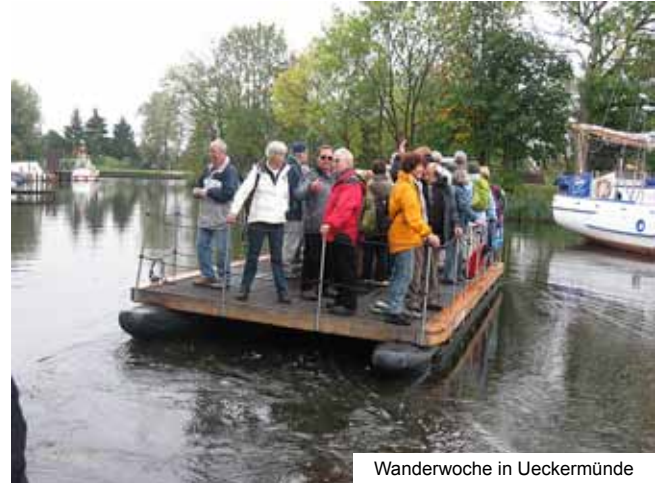
Wanderwoche in Ueckermünde