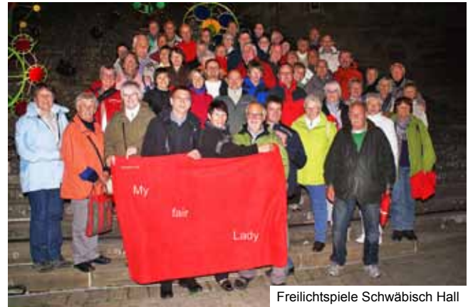
Freilichtspiele Schwäbisch Hall